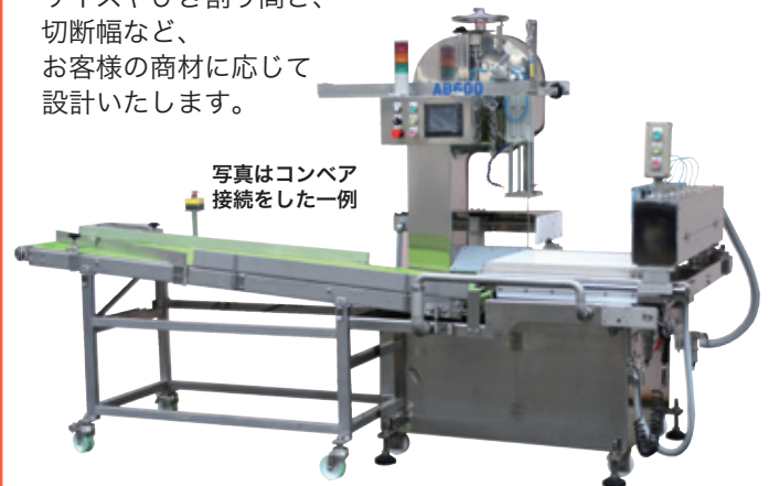
写真はコンベア接続をした一例

自動送り装置により、商材をセットして厚み幅を設定したら、あとは機械任せ。 商材を手に持つことがありませんから安全に作業ができます。 サイズやひき割り高さ、切断幅など、お客様の商材に応じて設計いたします。