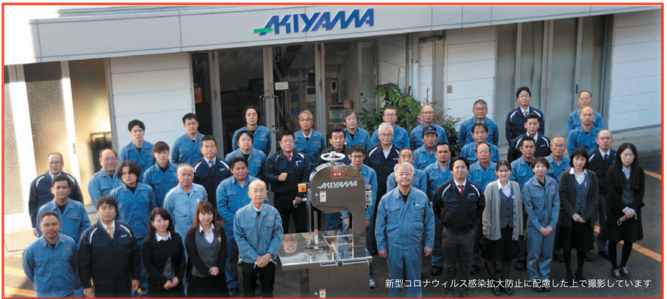
新型コロナウイルス感染拡大防止に配慮した上で撮影しています