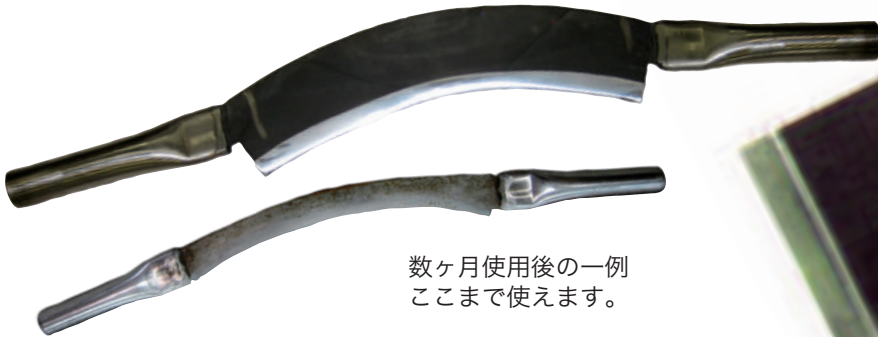
数ヶ月使用後の一例 ここまで使えます。

取っ手部分をステンレス製にした「ステンレスハンドル柳刃」なら、焼き入れ幅も広く長寿命です。特別オーダーも承っております。