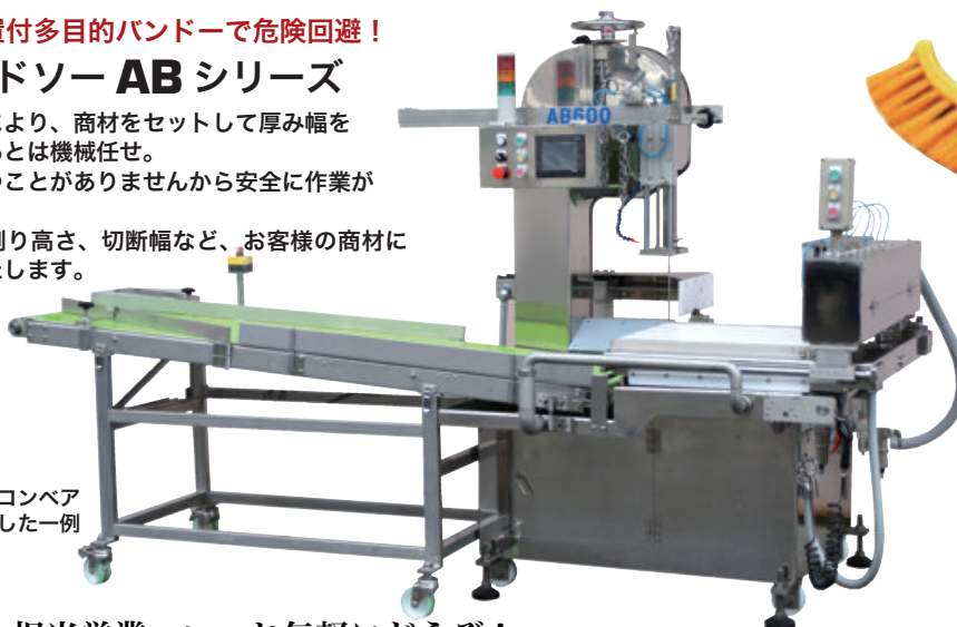
写真はコンベア接続をした一例

自動送り装置により、商材をセットして厚み幅を設定したら、あとは機械任せ。 商材を手に持つことがありませんから安全に作業ができます。 サイズやひき割り高さ、切断幅など、お客様の商材に応じて設計いたします。