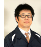
渋谷 国博 担当 関東・信越